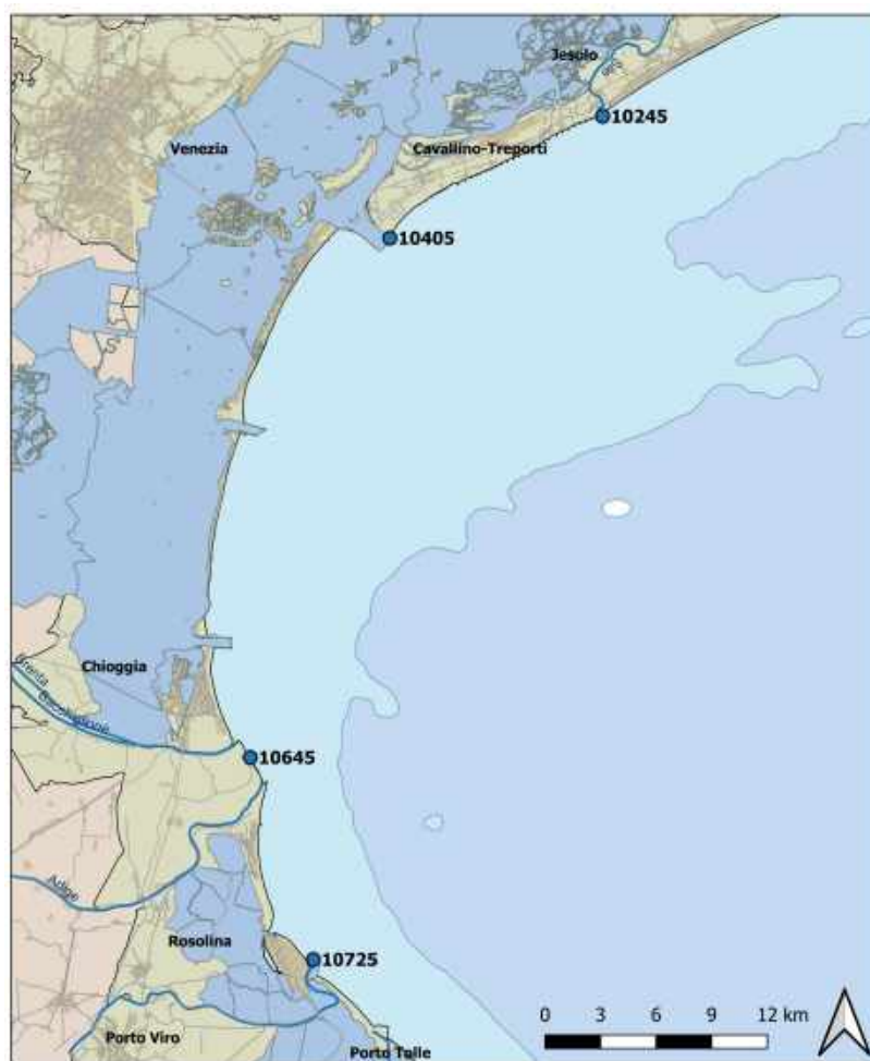
Figura 1: Localizzazione delle stazioni di campionamento