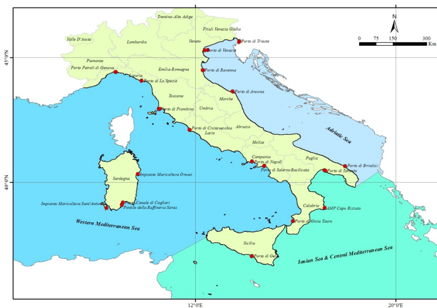
Figura 2. Stazioni di campionamento del monitoraggio Modulo 3 - ARPA