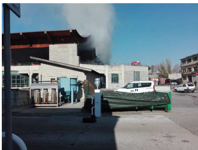
Campionatore alto volume presso impianto TMB

I valori di benzo(a)pirene misurati risultano tutti superiori al limite annuale previsto dal d.lgs. n.155/2010 ad eccezione del campione misurato presso la scuola giovedì 13 dicembre.