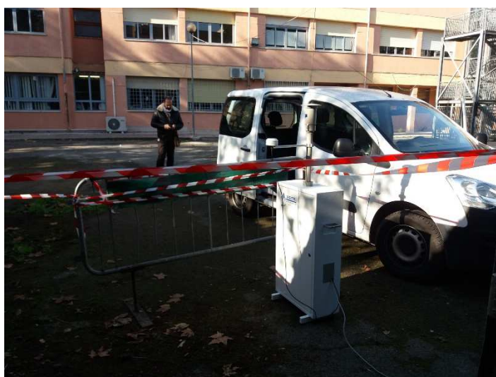
Campionatore presso la scuola