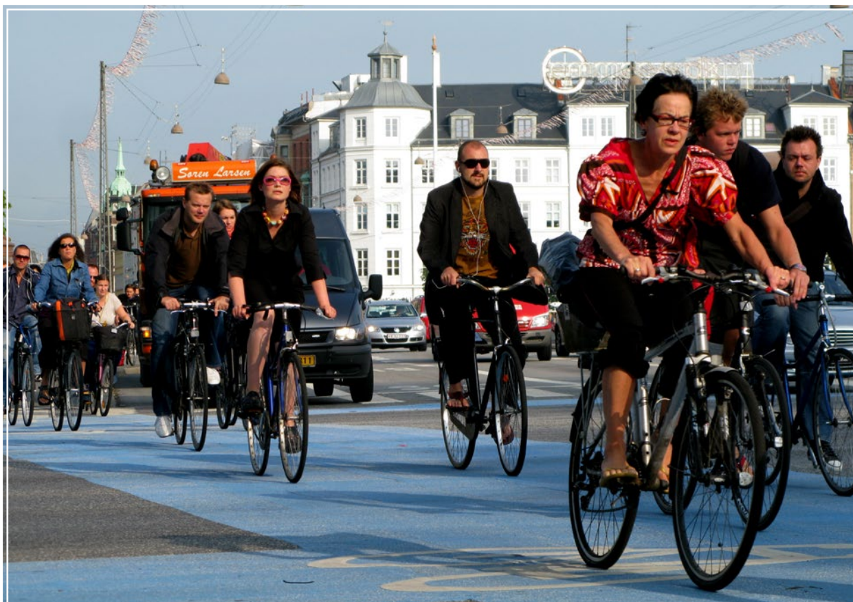
Traffico dell'ora di punta a Copenaghen, Danimarca.

Equilibrio. Il tema dell’equilibrio colpisce particolarmente la sensibilità del pubblico di centro-destra. In questo contesto, equilibrio significa evitare di porsi obiettivi troppo ambiziosi e seguire piuttosto una filosofia dettata dal buon senso. 22 Con un pubblico di centro-destra o di orientamento religioso, “equilibrio” è un concetto che può essere usato in senso metaforico, in cui il cambiamento climatico è sintomo di quanto il mondo si trovi in uno stato di disarmonia e malessere. 23,24