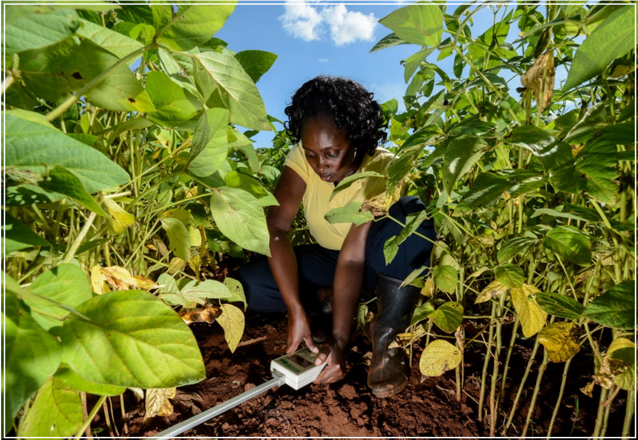
Test sullo stato di salute del suolo in Kenya.

Presentare le informazioni sotto forma di racconto permette di creare un legame più sostenibile e significativo con la scienza perché le persone comuni sono molto più abituate a scambiarsi informazioni attraverso storie che non tramite grafici e numeri. 52 L'uso del racconto nella comunicazione scientifica è sempre più diffuso: 53 la forma narrativa non solo aiuta il pubblico a capire concetti complessi e astratti, 54 ma li rende anche più facili da ricordare e da elaborare rispetto alle forme tradizionali di comunicazione della scienza, come elenchi di dati, grafici e figure. 55 Comunicare la scienza sotto forma di racconto è ancor più efficace quando si usa un linguaggio che rifletta le preoccupazioni degli ascoltatori.