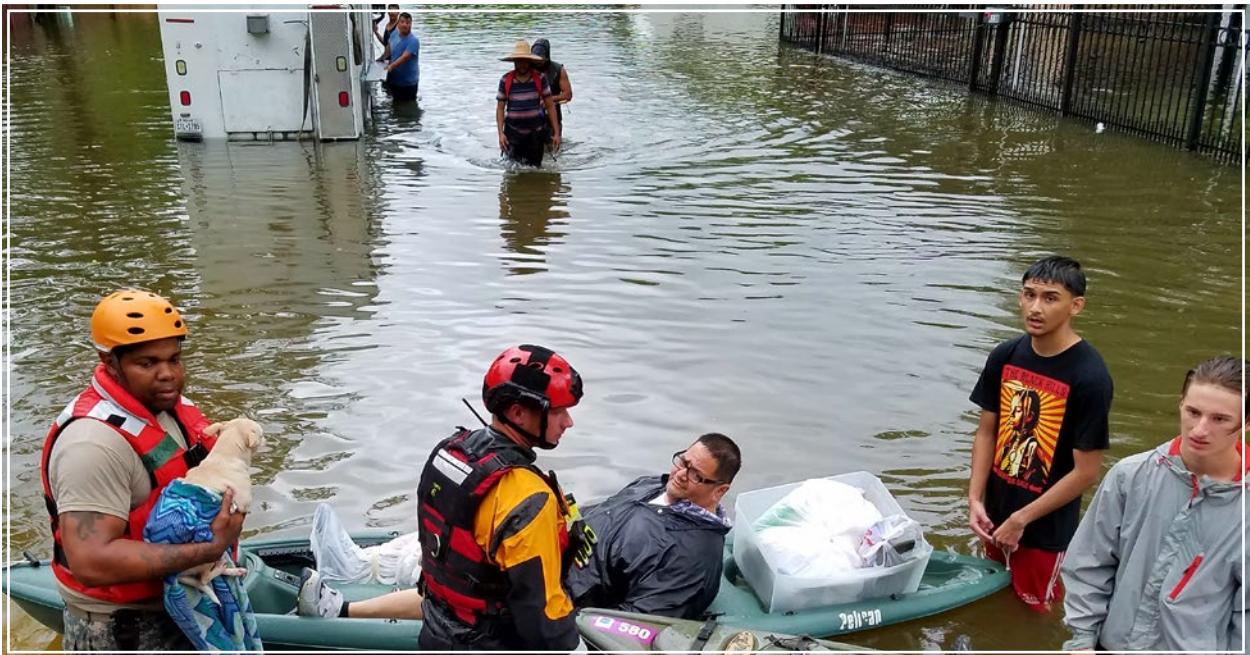
I militari della Guardia Nazionale del Texas soccorrono le vittime dell'uragano Harvey negli USA.