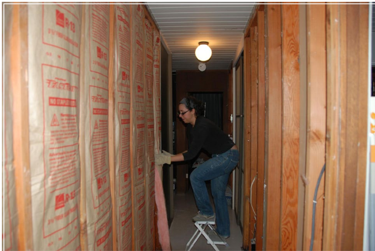
Installazione di pannelli isolanti domestici.

Nonostante questo studio si concentri unicamente sul Regno Unito (gran parte della ricerca riguardante la comunicazione sul cambiamento climatico viene condotta in Gran Bretagna o negli USA), esso fornisce un buon punto di partenza per affrontare il dibattito sul cambiamento climatico.