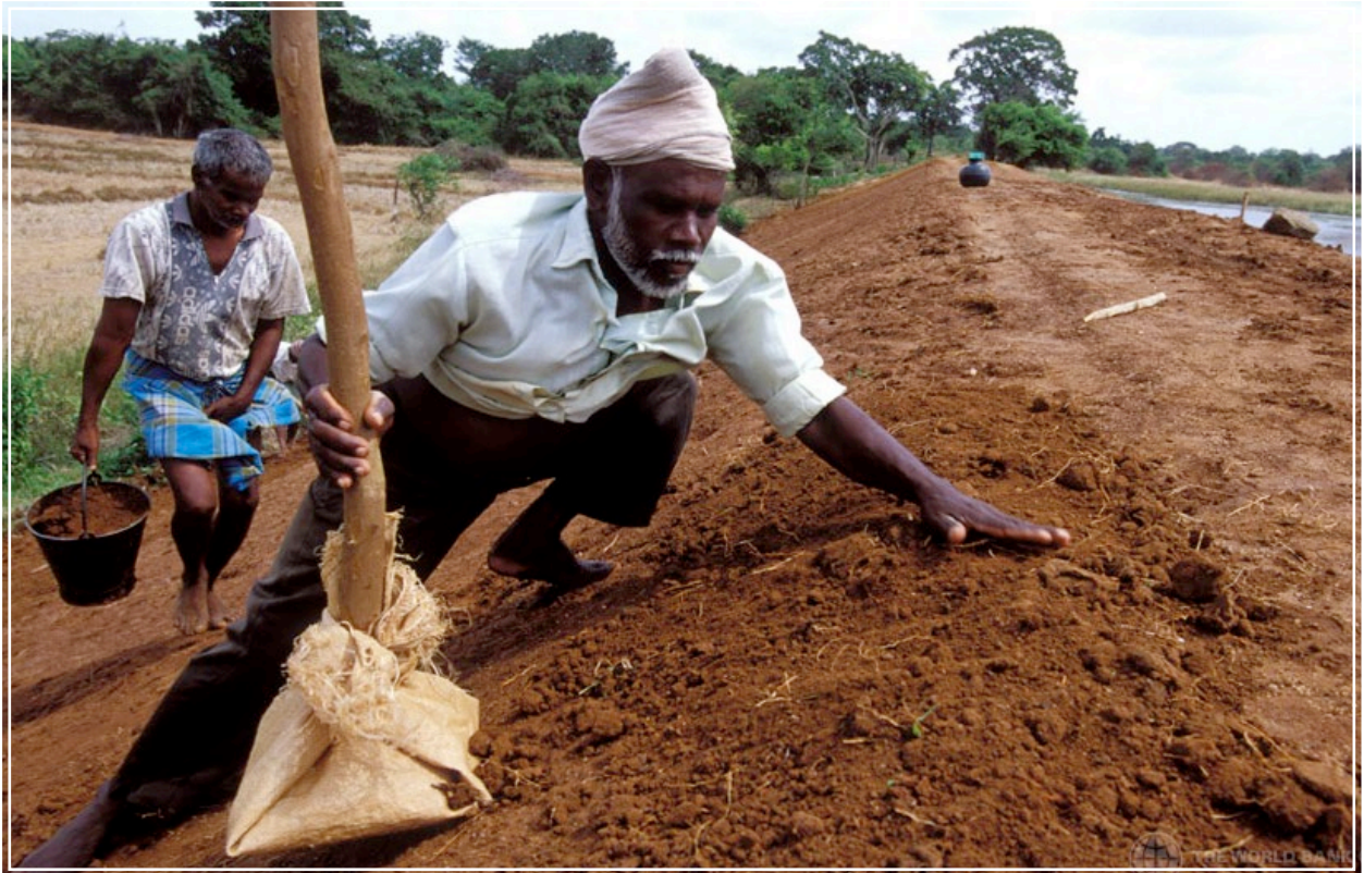
In Sri Lanka, due uomini riparano un argine in cui si è aperta una breccia.