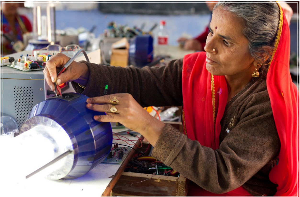
India: formazione tenuta da un'esperta in ingegneria solare.